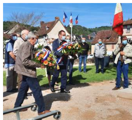
La cérémonie du 8 mai (Beaulieu)