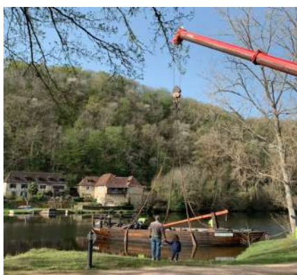
Remise à l'eau de la Gabare (Beaulieu)