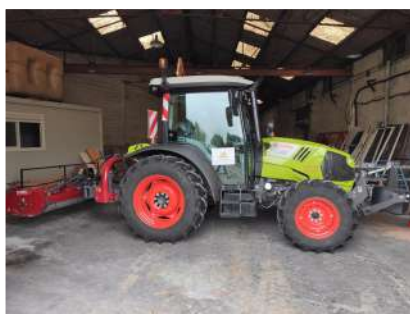
Nouveaux matériels : Tracteurs et gyrobroyeur