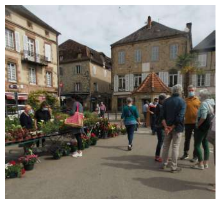
Le marché de Printemps du 9 mai (Beaulieu)

Piscine : réouverture aux scolaires à partir du 25 mai en respectant les contraintes sanitaires.