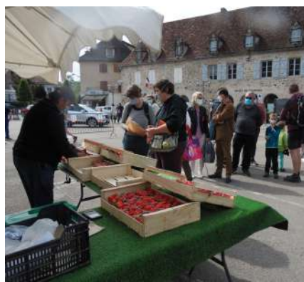
Le marché de Printemps du 9 mai (Beaulieu)