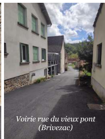
Voirie rue du vieux pont (Brivezac)