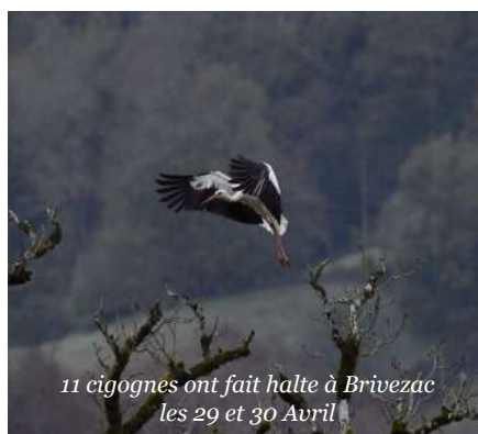
11 cigognes ont fait halte à Brivezac les 29 et 30 Avril