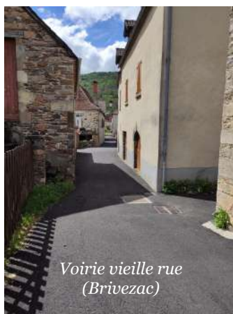
Voirie vieille rue (Brivezac)