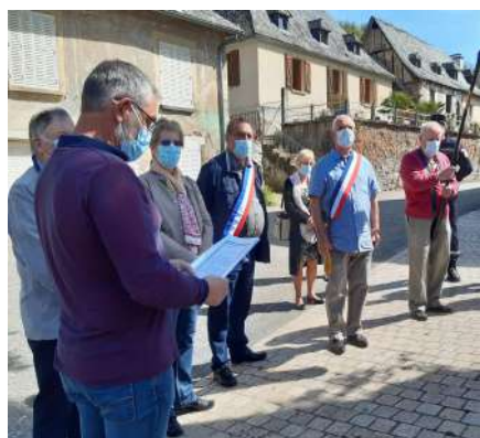
La cérémonie du 8 mai (Brivezac)