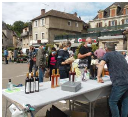
Le marché de Printemps du 9 mai (Beaulieu)